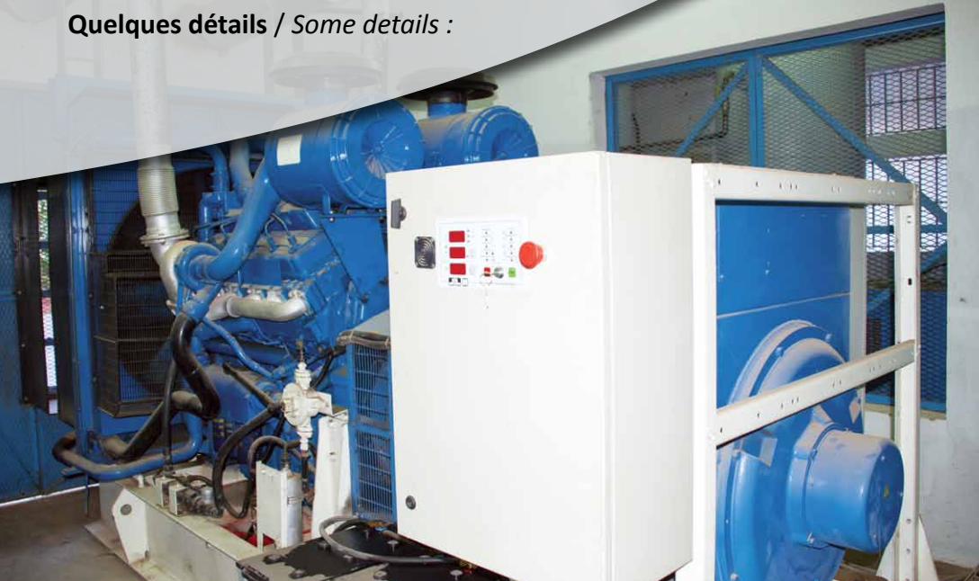
Groupe électrogène 800 KVA / Generator 800 KVA