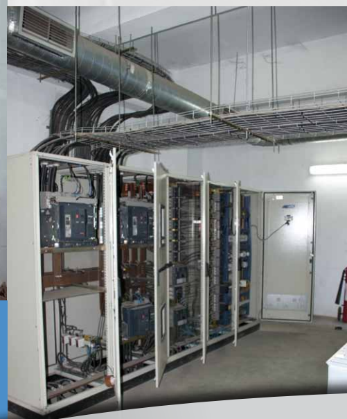
Armoires électriques BT / LT electric cupboards