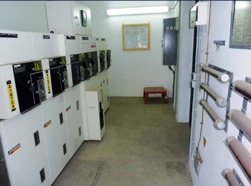
Armoire générale BT / LT general electric cupboard